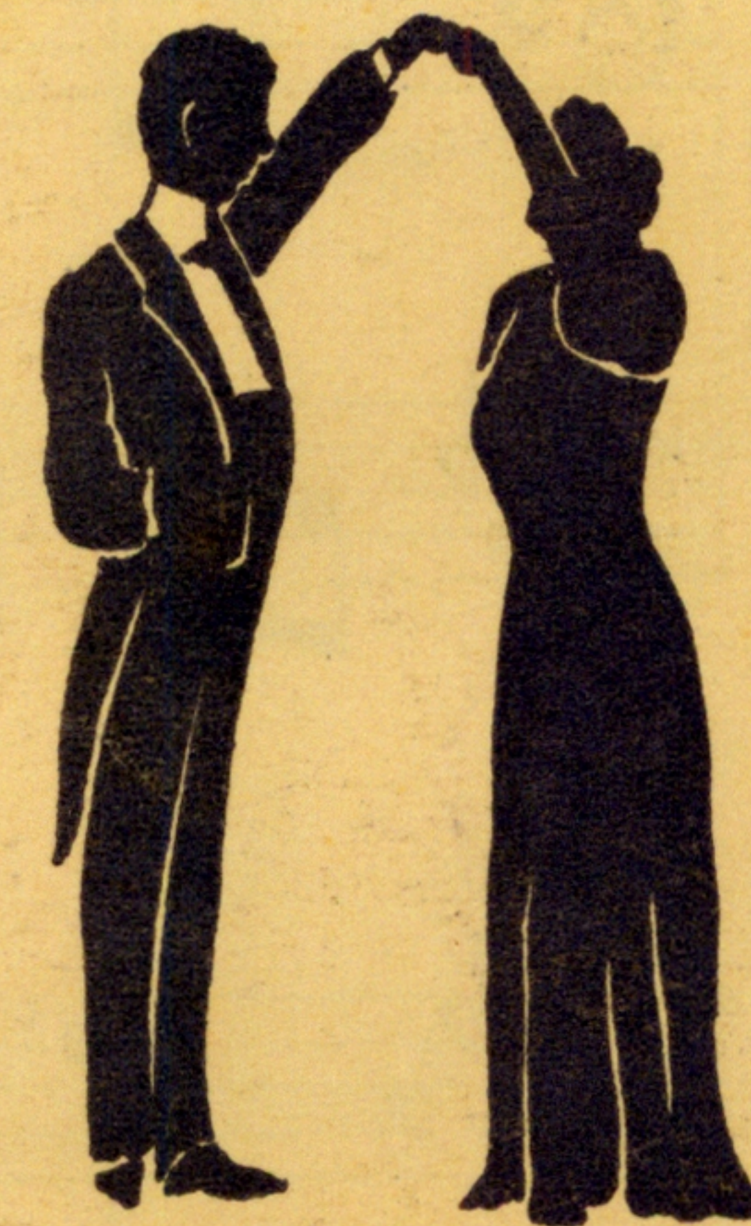
Рис. № 2. Дама дѣлаетъ тѣ-же па лѣвою ногою и при 3-мъ па поворачивается лѣвымъ плечемъ. Затѣмъ кавалеръ и дама возвращаются въ то-же положеніе но уже лицомъ en face Рис. № 3.

Кавалеръ правою ногою дѣлаетъ 2 па шассе , при 3-мъ па приступиваетъ лѣвою ногою и повертывается правымъ плечемъ къ дамѣ.