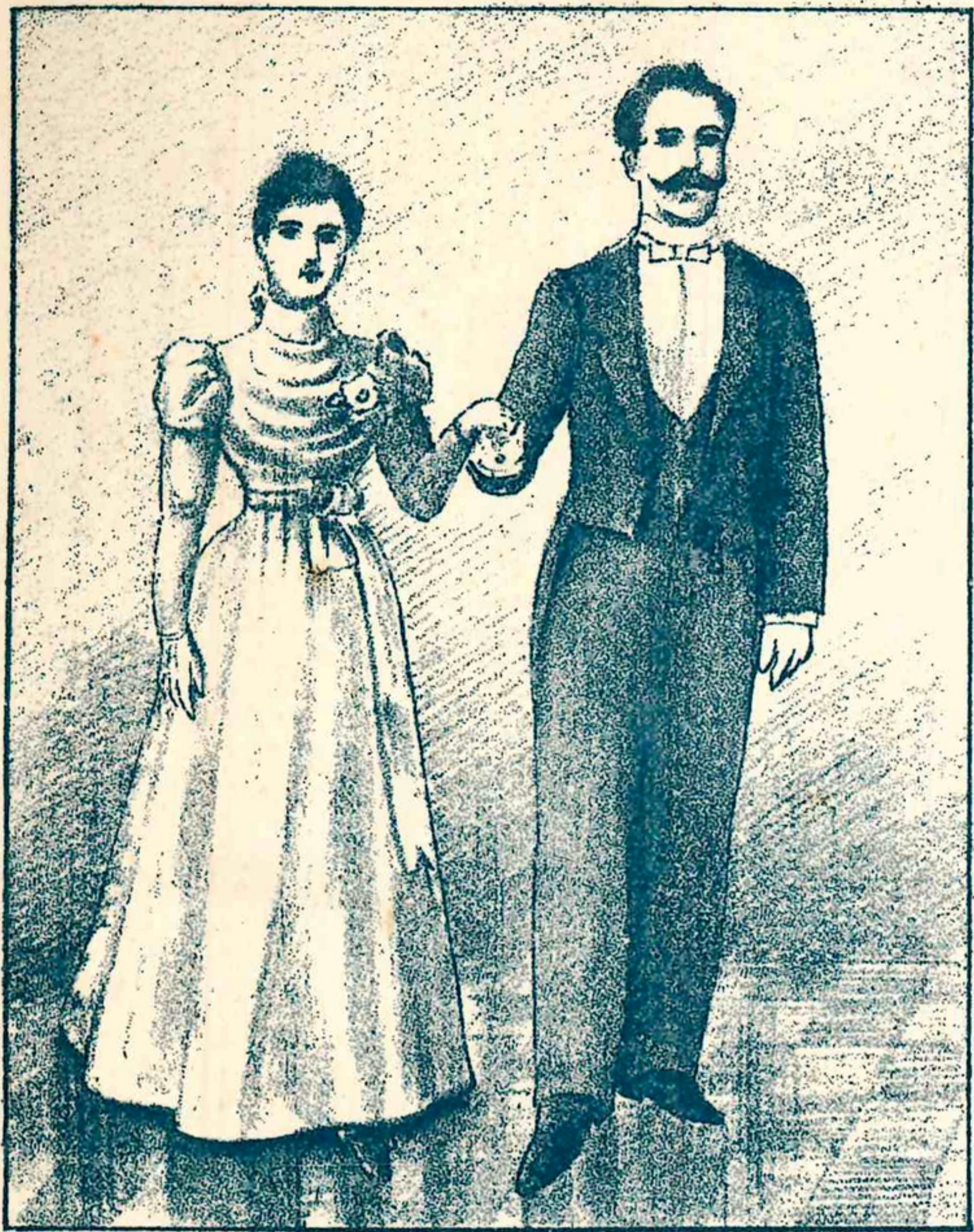
1. Pas de marche ordinaire. 1. Па марше.