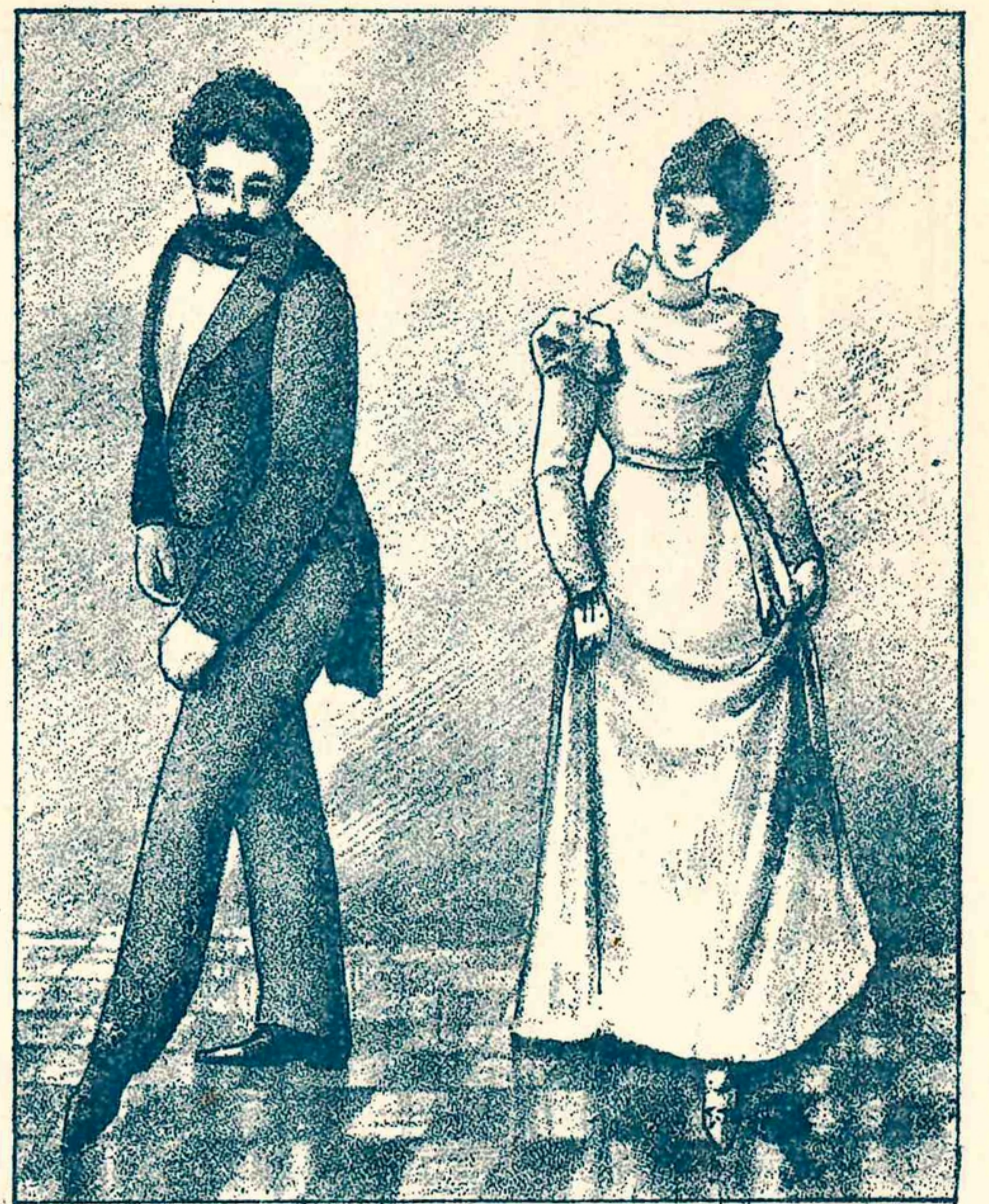
4. Pirouette. 4. Пируеттъ.