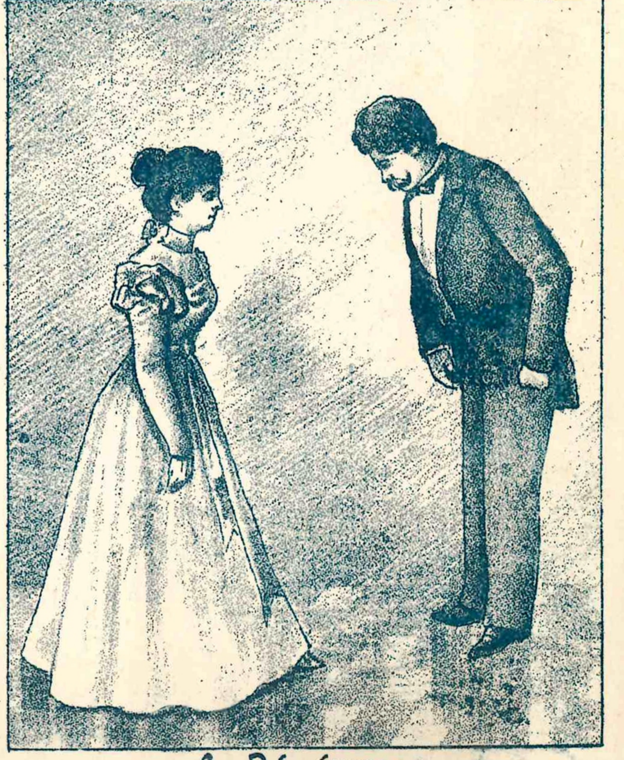
6. Révérence. 6. Реверансъ.