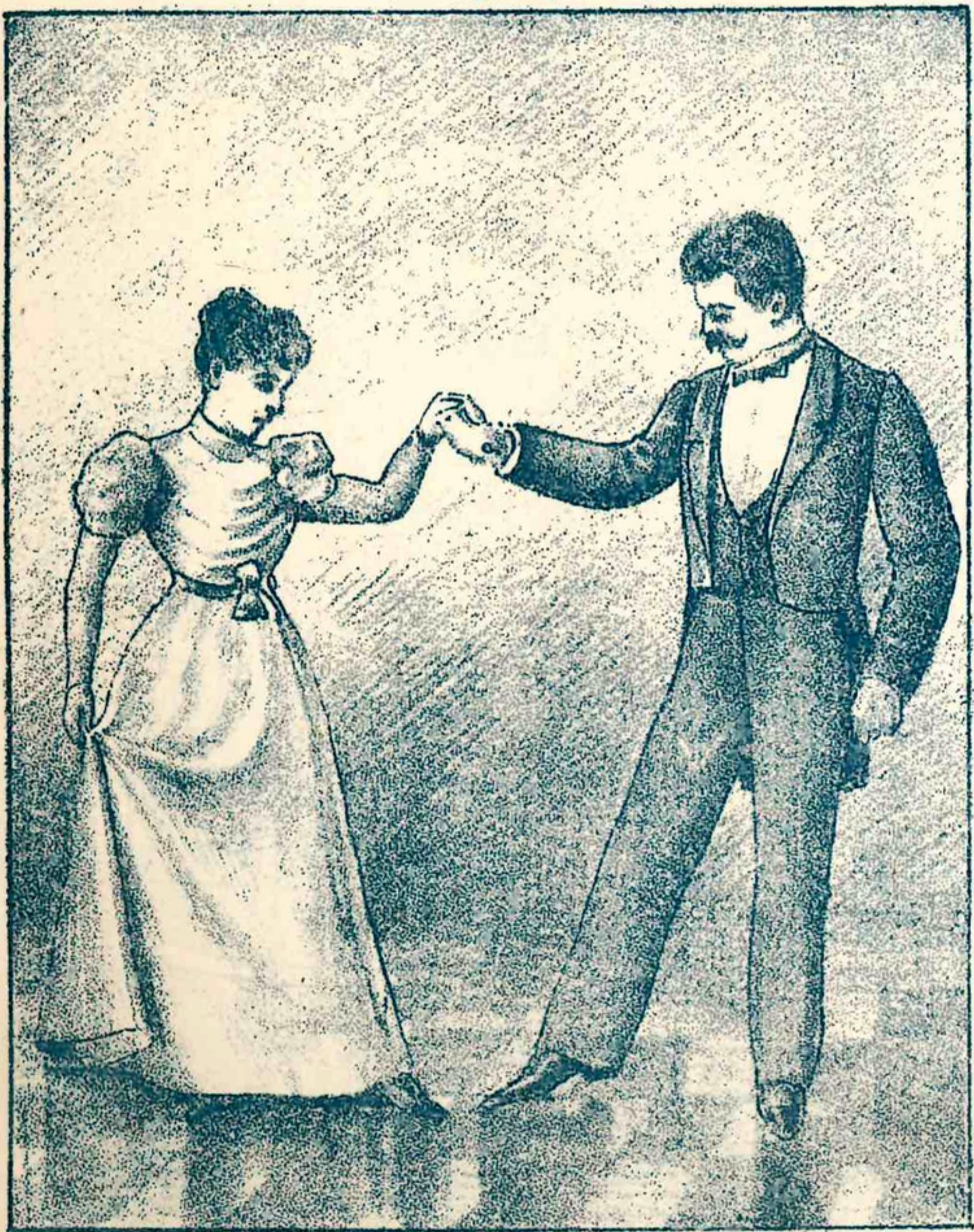
3. Petit battement en dedans. 3. Пти батеманъ.